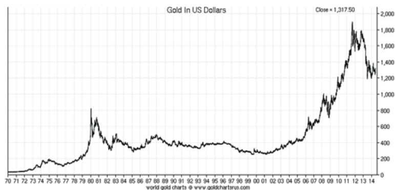
L'évolution du prix de l'or entre 1970 et 2015 (1 once/USD)

Il est intéressant d'observer l'évolution du taux de change de l'or par rapport au dollar. Le graphique représente le changement d'une once troy d'or (31.1 grammes) exprimée en dollar pendant les cinquante dernières années. Pendant la crise de la dette souveraine, après la crise économique mondiale de 2008, le prix d'une once d'or atteignit la valeur de 1900 dollars américain. Le FMI possède une réserve d'or assez importante, de 90 millions d'onces troy. (Les changements du prix de l'or entre 1970 et 2015 ; 1 once/USD) 10