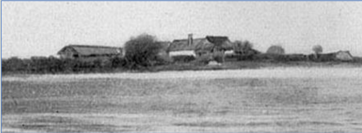
Homokháti belvíz elöntés felvétel

Ahogy városunknak különösen sürgető fontosságú, úgy országos viszonylatban is halasztást nem tűrő ügynek számít a mezőgazdasági művelésre befogható földszelvények szivattyúzás útján, víztől való megszabadítása. Az elkészült törvénytervezet alapján a vizektől állandóan vagy időszakosan borított olyan területek lecsapolása iránt lehet intézkedni, amely területek a lecsapolás által mezőgazdasági művelésre alkalmasokká tehetőek (mocsár, nádas) vagy amelyeknek termelőképessége a lecsapolás által gazdaságosan fokozható. Ha belvíztől károsított vagy emiatt mezőgazdaságilag nem művelhető területek valamely ármentesítő társulat árterébe tartoznak, a belvizek levezetése az ármentesítő társulatok feladata.