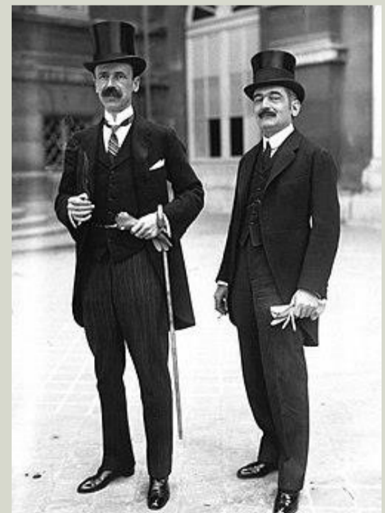
Bethlen István miniszterelnök és Kállai Tibor pénzügyminiszter

Mindezek mögött viszont a tisztelt olvasóközönség ne sejtjen jobboldali szélsőséges összeesküvést. „Mi van a Pick szalámiban?”, és mit forgat Bethlen István a fejében? A feltehető legnehezebb kérdésre most két okból is csak a szegediek tudhatják a választ. A szerkesztőség konszenzusos véleménye szerint hogyha Bethlen István a kommunizmus ellen kíván védelmezni, akkor az e célhoz felhasználható minden erőre szükség van, evégett szükséges a radikalisták bevonása, egyben beolvasztása a pártba. Mindazonáltal a szélsőségesek befolyása is korlátozható azzal, ha a párt rendszerén belül lehet őket visszafogni.