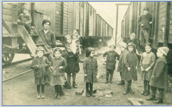
Vagonlakók a szolnoki pályaudvaron

hivataloktól a legritkább esetben kapnak. virágzik a korrupció.