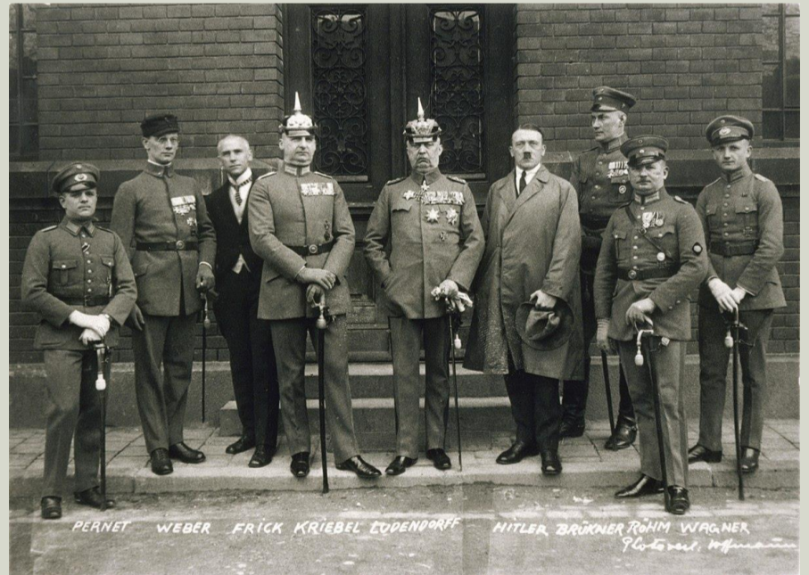
Az akciót sikeresnek vélő Hitler és Ludendorff

Az akció napjának korai óráiban radikális gárdisták százai vették körül a Bürgerbräukeller serházat, ahol tartományi nagygyűlést tartottak. Hitler kíséretével bevonult az ülésterembe, és provokatív beszédekkel maga mellé állította a jelen lévő hivatalnokokat és polgárokat. A pártvezér Kahr kormánybiztost is -ugyan hathatós fenyegetés árán- meggyőzte arról, hogy a bajorországi népszerűségüket kihasználva induljanak a meggyengült berlini kormány ellen, azt buktassák meg és vegyék magukhoz az ország irányítását. Az esti órákban megjelent a többszörösen kitüntetett hadlótton Erich von Ludendorff tábornok, aki a Berlin elleni menetelést vezényelte volna.