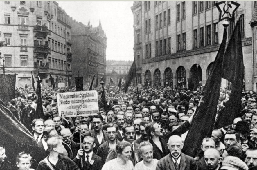
Az októberi hamburgi zendülés tömege

Gondolhatnánk, hogy a magyarországi vörös terror, Károlyi Mihály kudarcos kormányzása és az Oláh megszállás az anarchia minden arcát megmutatta Európának, de ha nyugatra tekintenénk, látnánk, hogy régi Német bajtársainkat is -önkéntesen kikiáltott hadibűnös-ként- az összeomlás szélére sodorták az Antant hatalmak. A megalázás teljessége végett a Francia hadsereg bevonult a Rajna vidékére is.