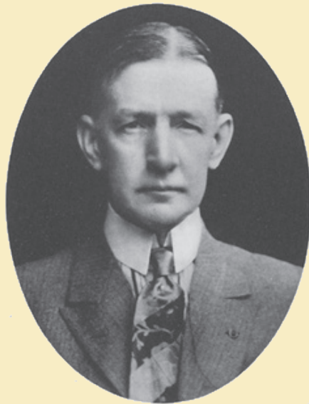
Charles G. Dawes

Az idő azonban rohamosan fogy, az elmúlt évek során többször is veszélybe került - a kedvezőtlen európai gazdasági helyzet miatt - a háború során nyújtott támogatás visszafizetése. Az amerikaiak szerencsésére a háborús jóvátételek rendezése a többi antant hatalomnak is érdekében áll. Jelen állás szerint az ügy lezárásának irányába haladnak a dolgok és rövid időn belül rendelkezés várható ezen a téren.