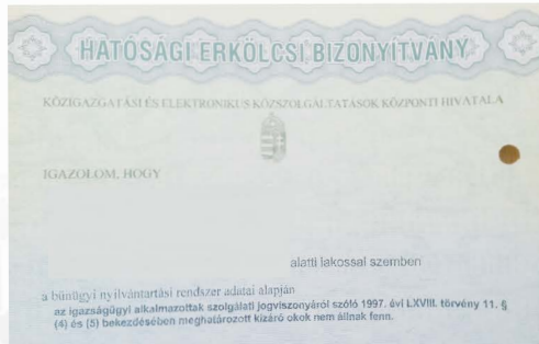
hatósági erkölcsi bizonyítvány